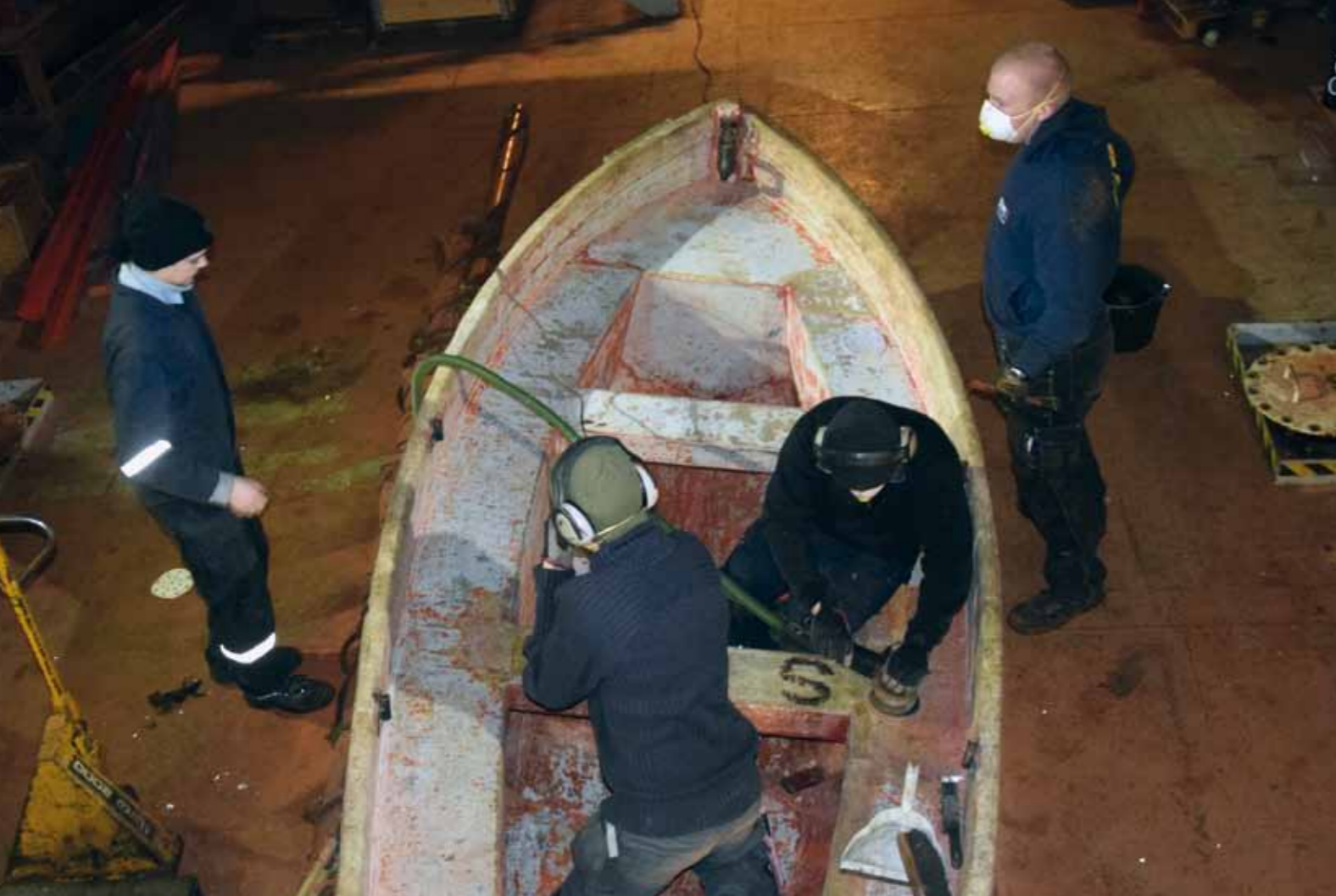
Sjömansskolan har idag tre klasser och ca 75 elever.