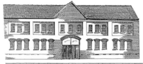
Pleasants Street Youthreach Building

centret inte på plats. Vi fick informell information om hur en arbetsdag såg ut av en manlig ”lärare” i matsalen. Efter en rundvandring i de rymliga hemtrevliga lokalerna tog en annan man oss till datasalen. Han berättade vikten av att verkligen tycka om att arbeta med de unga vuxna som inte har det beteende som förväntas i den irländska skolan. Därefter kom chefen, en kvinna som varit tvungen att prioritera deltagarna före oss. När mannen gick applåderade vi alla. Det var första och enda gången under veckan. Vi blev alla påverkade av det han berättade. Chefen presenterade därefter hur verksamheten fungerar och samtliga av oss var berörda av det engagemang som finns och hur bra man kan bygga upp en verksamhet som ska utmytna i anställningsbarhet och välmående för deltagarna. Samtliga mentorer arbetar efter samma koncept. En cirkel med ”tårtbitar” som alla deltagare ska arbeta med. Samtliga ”tårtbitar” ska fyllas med kunskap. I vilket skede är individuellt. Vid detta besök klarnade det kring vilken misär många lever i på Irland. Att det sociala arvet är något som de vid denna verksamhet jobbar för att bryta.