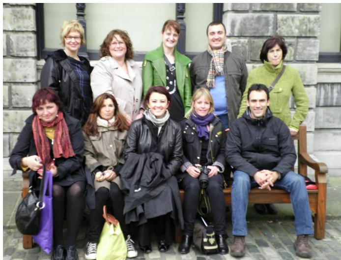
Hela gänget utanför Trinity College

Nu var det dags för erfarenhetsutbyte då vi deltagare under två av dagarna besökt olika former av skolor med vägledningsfunktioner. Även om alla utom den privata skola jag besökte, drivs av det som motsvarar svenska kommuner, så är de väldigt olika. Några besökte flickskolor där nunnor arbetar. Vissa besökte skolor där eleverna bar skoluniform medan det i andra skolor inte användes. I diskussionerna framkom det att flickorna som bar uniform kände en tillhörighet och tyckte att det var skönt utan killar i skolan. De berättade att de kan koncentrera sig på skolarbetet och de behöver inte göra sig snygga. Å andra sidan frågade ingen eleverna i mixade skolor hur de såg på saken. För oss från de övriga länderna är det normen. Vi kom samtliga överens om att uniform eller ej, könsmixade skolor eller inte, hård disciplin eller ej – allt har både fördelar och nackdelar.