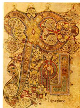
Books of Kells

Förutom ”arbete” har Dublins utbud av museum lockat mig. Det nationella museet gav mig kunskap om Irlands historia där ”vi” vikingar har spelat en stor roll. Det arkeologiska museet med Egyptiska mumier samt samlingar av irländsk historia och biblioteket vid Trinity College med ”The Books of Kells” som dragplåster, var intressant. Att gå in i biblioteket var som att stiga in i Stora Tuna kyrka i Borlänge. I stället för en luftig miljö stod höga bokhyllor tätt utmed väggarna, med stegar i olika nivåer som nådde ända upp till taket. Dessa böcker används ännu i dag för att leta information. Det var en kontrast till dagens utbyggda informationsteknik! Vi deltagare besökte även en mycket roande teaterföreställning en av kvällarna. Vi åt middag tillsammans med vår mycket duktiga och omtyckta coordinator från Irland och besökte ett antal Irländska pubar. Inte en eftermiddag eller en kväll, utan så fort tillfälle gavs. Alkoholintaget denna vecka blev aningen högt, men visst ska man ta seden dit man kommer? Nja, kanske inte. Men trevligare miljö än en Irländsk pub, med levande musik, dans och glädje, får man leta efter!