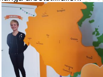
Eskilstuna kommun Goda hållbara möten

Vilken tur att du bor i Eskilstuna, här finns många arbetstillfällen.