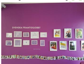
Eskilstuna kommun Goda hållbara möten

Vad vet vi om framtidens jobb? Vad innebär automatisering och datorisering?