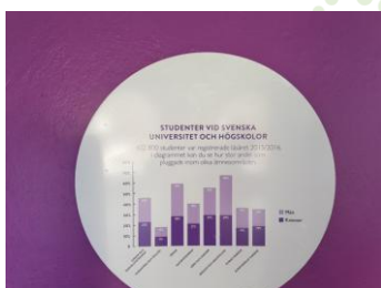
Eskilstuna kommun Goda hållbara möten

Vilken tur att du bor i Eskilstuna, här finns många arbetstillfällen.