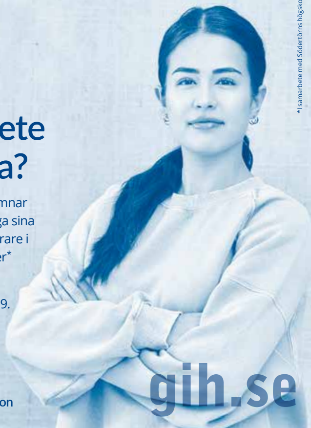
* I samarbete med Södertörns högskola

Gymnastik- och idrottshögskolan vid Stockholms Stadion